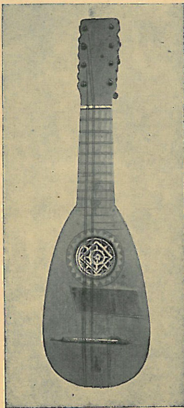
Mandoline (Nr. 649) (Instrumentenmuseum Universität Leipzig)