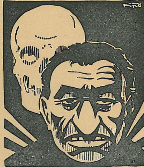
Der Stürmer gibt zum Reichsparteitag eine Sondernummer heraus, betitelt

Redaktionsluß für die November-Nummer 15. Oktober 1935.